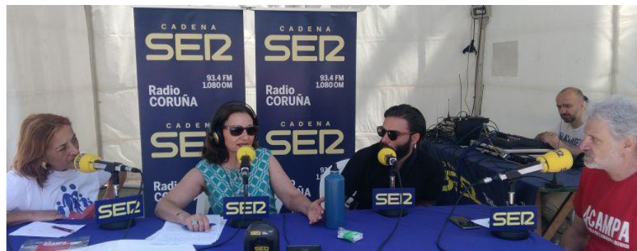
Programa en directo de Radio Coruña – Cadena Ser no campamento.

Durante os días do evento, fixéronse varios programas de radio en directo dende o campamento, o que fixo que máis xente coñecese a iniciativa e quixeran achegarse a coñecer as instalacións, así como a participar dos talleres e escoitar as charlas.