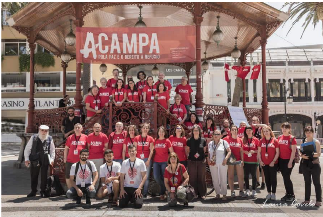
Equipo de Acampa.

A relación co Concello de A Coruña foi sempre constante e de apoio ao evento, xa que este comezou coa aprobación do proxecto por parte das axudas de Cultura de Barrio organizadas polo Concello. As relacións sempre foron fluídas, de axuda e de convencemento de que era preciso un evento destas características para significarse a cidade da Coruña como cidade refuxio. Apoiou ademais o Concello a iniciativa mediante a convocatoria dunha rolda de prensa no Concello para dar difusión e dar apoio público á iniciativa. O Concello de Ferrol sumouse á proposta, e convocou tamén unha rolda de prensa no seu Concello, así como ofreceuse a organizar Acampa o ano que ven na súa cidade tamén. A Deputación de A Coruña , ofreceu así mesmo un gran apoio á organización de Acampa, e contouse coa presenza institucional no acto de inauguración. sin esquecer coma xa se dixo, a presenza da UDC representada polo seu Reitor Magnífico.