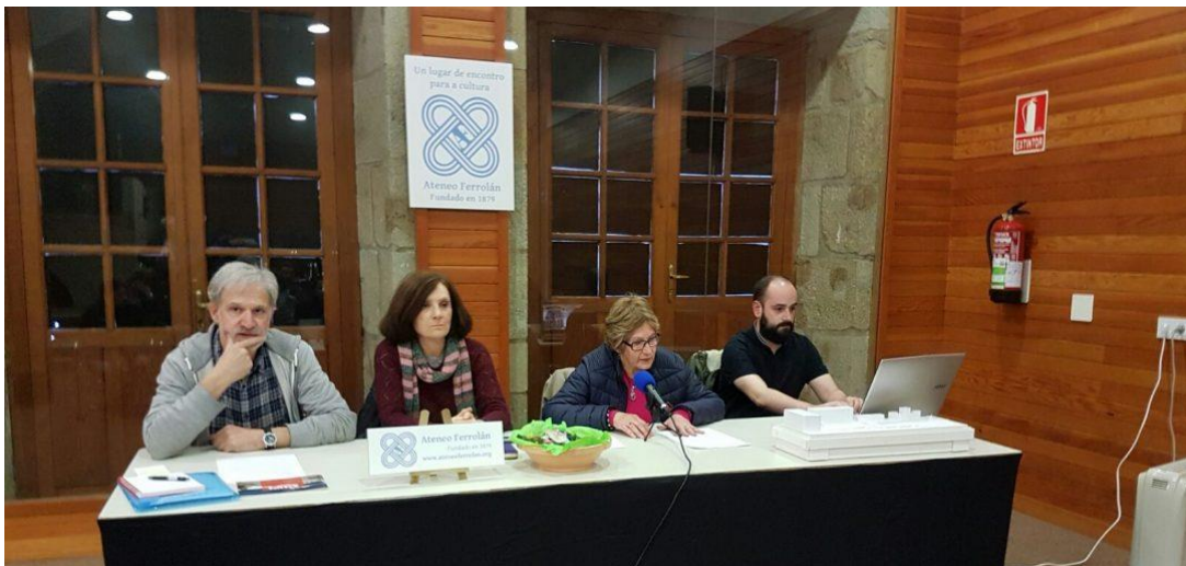
Presentación de Acampa no Ateneo Ferrolano, organizado pola Asociación Fuco Buxán.

Outras xuntanzas informativas tiveron lugar en diferentes centros educativos da cidade, para por en coñecemento das persoas máis novas o drama da busca de refuxio. Estas charlas tiveron unha gran aceptación e causaron un enorme interese entre o alumnado e profesorado, que amosaron a súa sensibilidade cos temas expostos. Na educación temos a esperanza do futuro, os máis xoves serán os que movan o mundo do mañá, polo que para Acampa era moi importante ter presenza nos centros educativos .