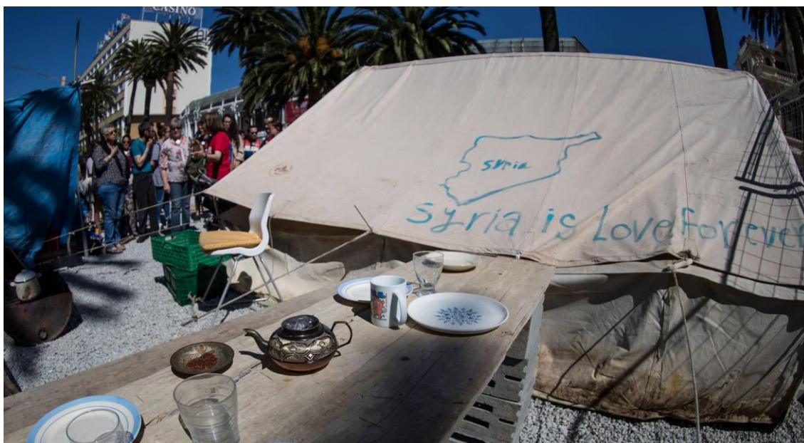
Fotografía de medios de comunicación, réplica do campamento.