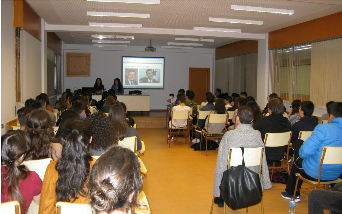
Presentación de Acampa no IES A Sardiñeira.

Co convencemento de que Acampa puidese tecer unha rede entre as asociacións, institucións e oenegués que están a traballar sobre o tema do refuxio, houbo con elas diferentes xuntanzas para presentar a iniciativa e poder estruturar esa gran rede que estábese a tecer. Era a primeira vez na cidade da Coruña que ían a estar presentes tantas agrupacións que traballan na defensa dos Dereitos Humanos, e era para Acampa moi importante que houbo un traballo previo importante para que todo saíse da mellor forma posible, e que para todos fose esta unha gran experiencia na que compartir informacións, proxectos e ideas.