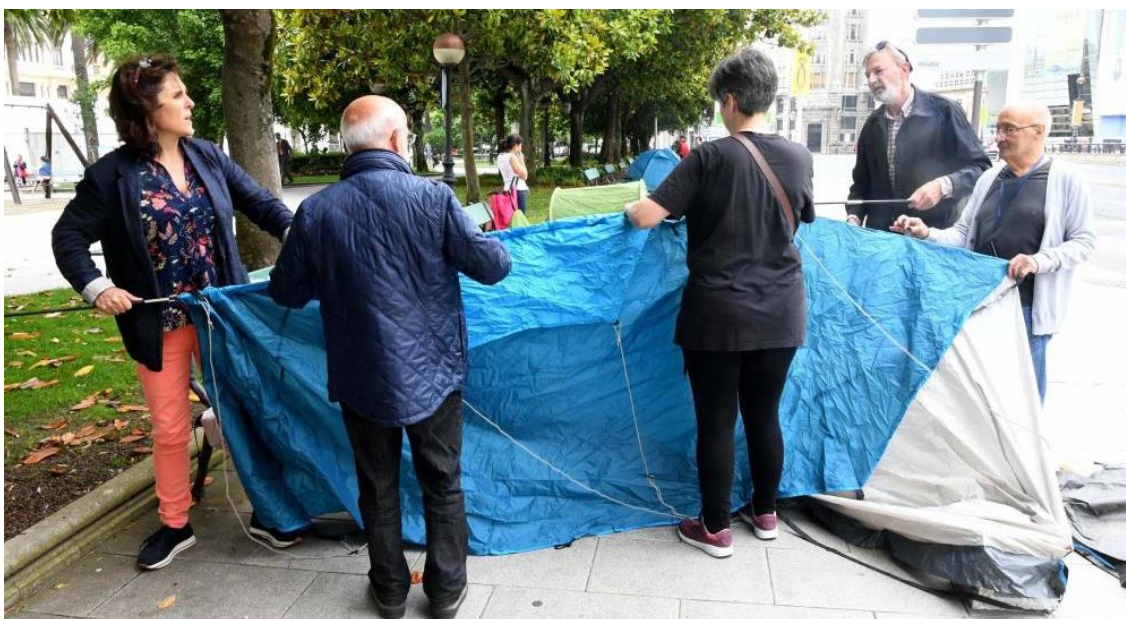
Montaxe das tendas institucionais nos Xardíns de Méndez Núñez.

Parte importante do equipo de medios de comunicación foi a convocatoria de diferentes roldas de prensa para presentar o proxecto, ca presenza de prensa escrita, radio e televisión, así como diferentes personalidades que puidesen apoiar a iniciativa.