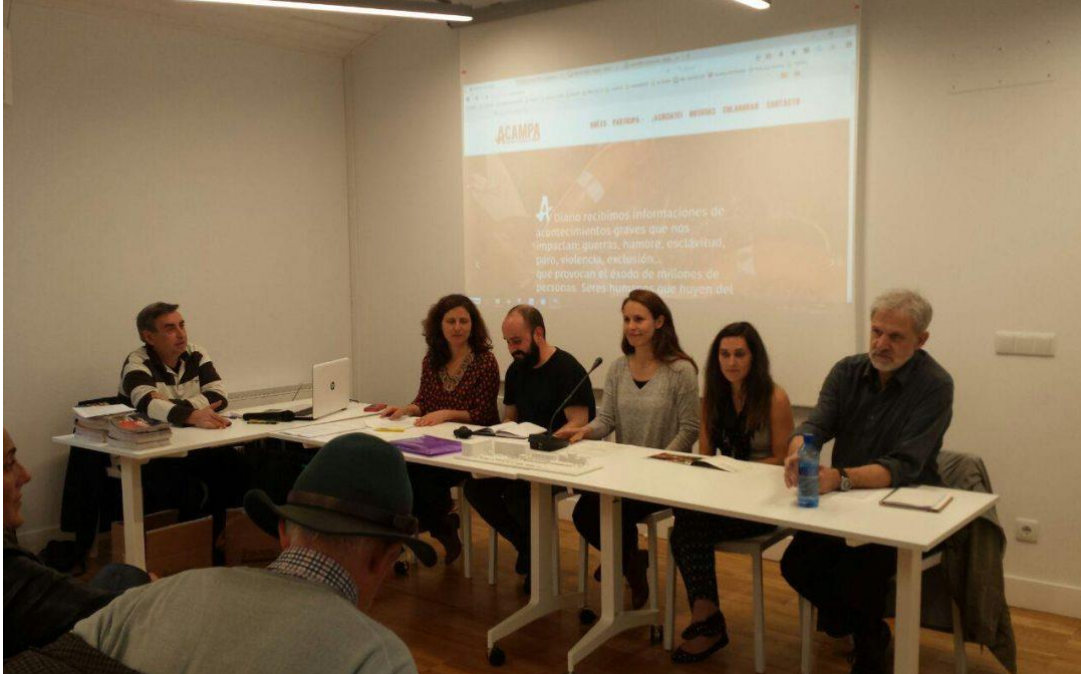
Presentación de Acampa no Centro Cívico da Cidade Vella.

Era algo moi importante a visibilización do drama do refuxio xa antes de por en marcha o evento, para que a cidadanía tivese un coñecemento previo da situación para poder acudir ao evento cunha mente xa máis aberta e informada. Para elo, fixéronse presentacións de Acampa en diferentes espazos da cidade, así como en centros de outras cidades.