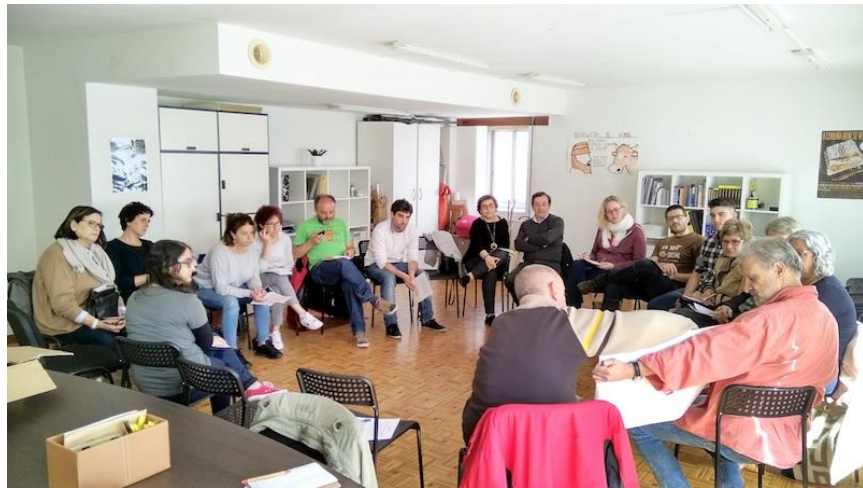
Xuntanza previa para a organización do evento.

A organización do evento foi posible polo gran traballo realizado por cada un dos equipos, e polo traballo en rede feito mediante a coordinación dos equipos e as xuntanzas realizadas ao longo de meses de arduo traballo.