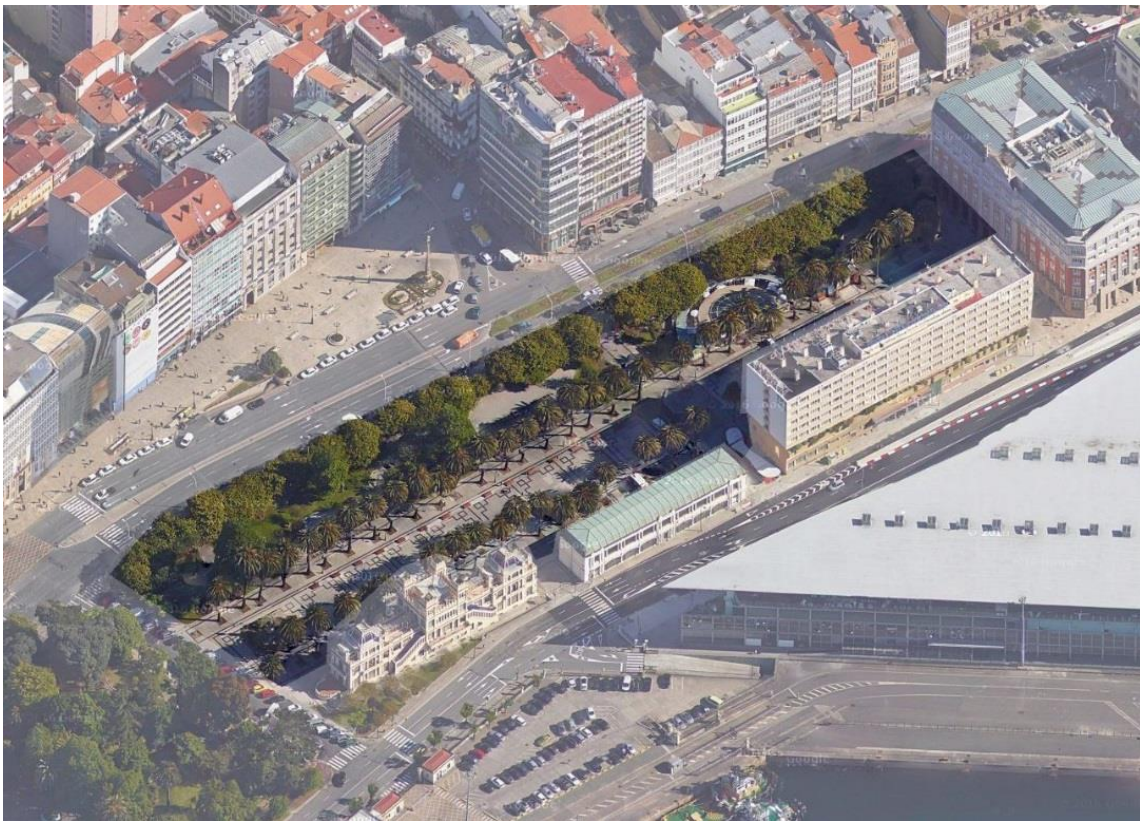
Vista en perspectiva do ámbito da actuación.

Os Xardíns de Méndez Núñez na Coruña delimitan ao suroeste pola Avenida dos Xardíns de Méndez Núñez, ao sueste polos edificios da radio e televisión galega, o Kiosko Alfonso e o Hotel NH Atlántico. Ao nordés, o edificio do Teatro Colón e a sede da Deputación de A Coruña, que limita a parcela. Polo noroeste delimita a Rúa Cantón Grande.