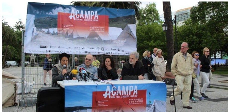
Rolda de prensa nos Xardíns de Méndez Núñez, maio de 2017.