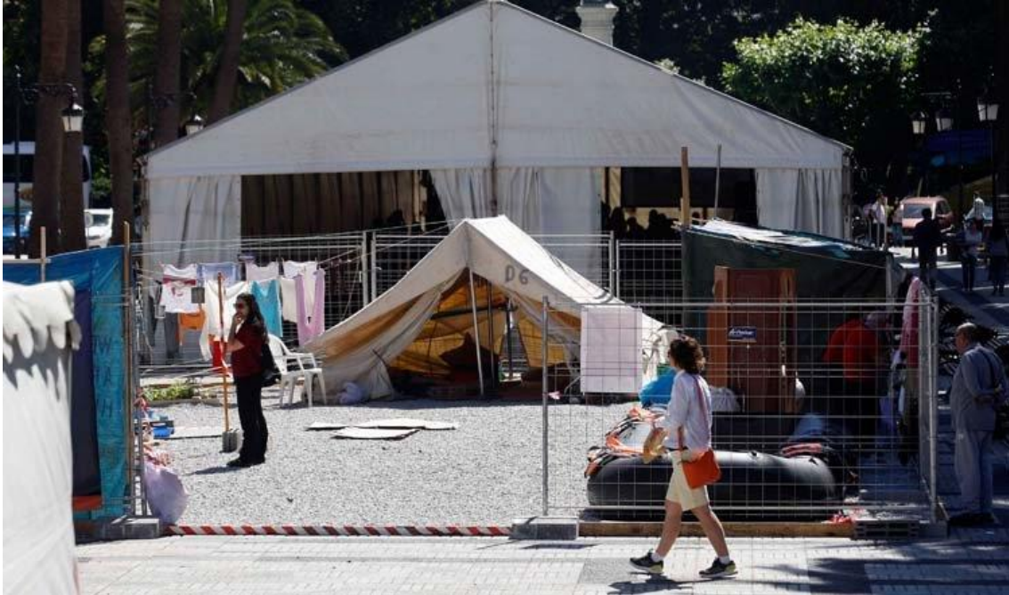
Réplica do campamento.

O resto de espazos do campamento, foron o lugar onde se desenrolaron o resto de actividades ao aire libre, como as actividades con nenos ou algúns dos obradoiros.